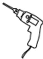
Drill Perceuse Taladro